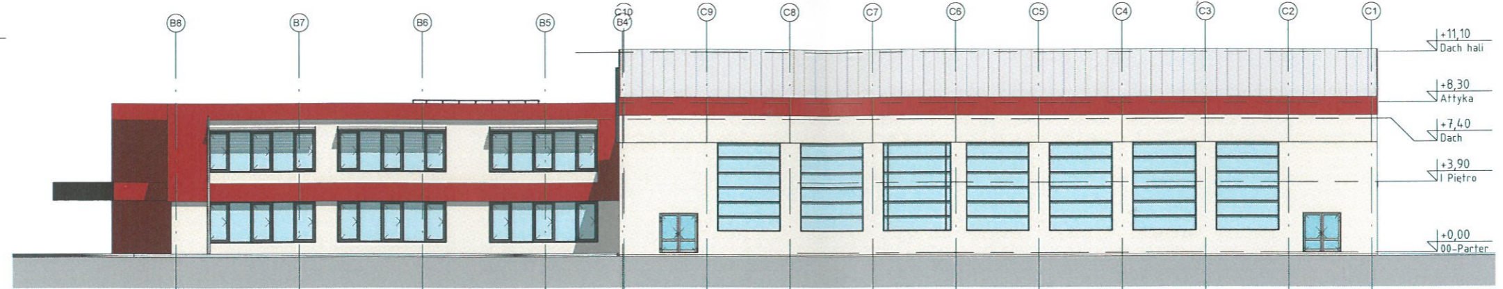
2 Elevacja Wschodnia 1:200